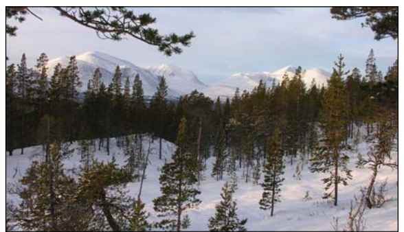
Utsikt fra nedre del av området mot "De blå fjella"